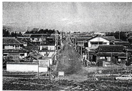
利根川の土手から衝突場所を望む